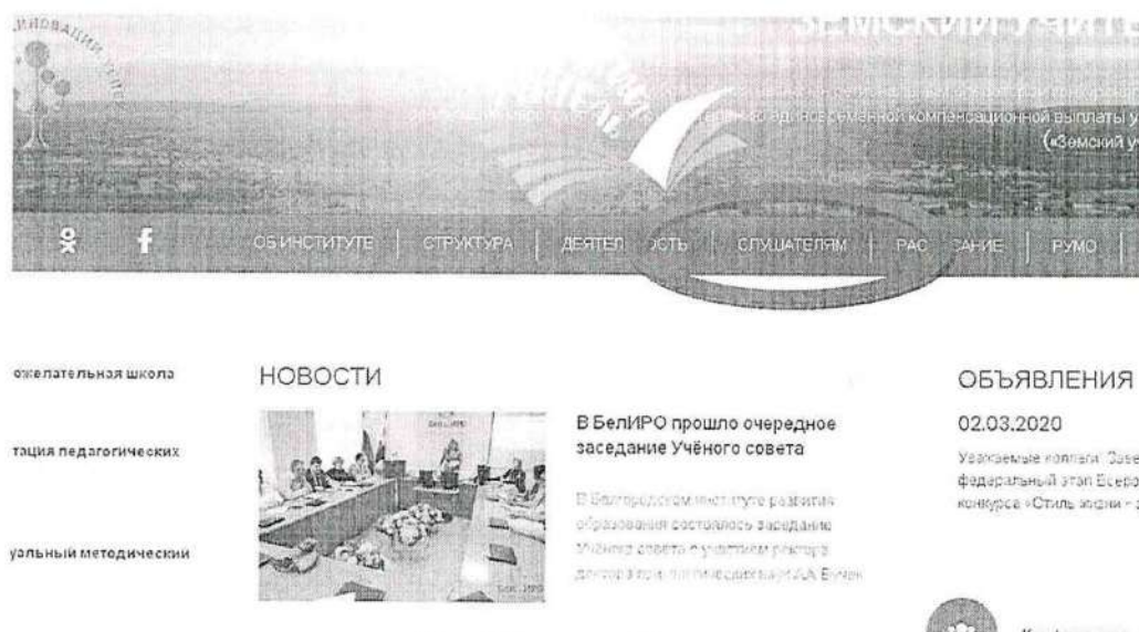
Рис.1 Раздел «Слушателям»